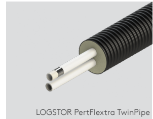
LOGSTOR PertFlextra TwinPipe