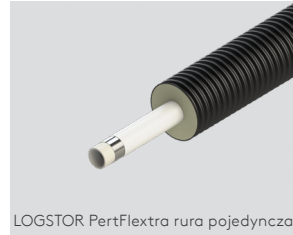
LOGSTOR PertFlextra rura pojedyncza

Średnice rury przewodowej 25 - 63 mm i osłony zewnętrznej 90 - 180 mm.