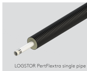
LOGSTOR PertFlextra single pipe

Dimension du tube de service 25 – 63 mm et dimension de l'enveloppe extérieur 90 – 180 mm.