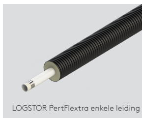
LOGSTOR PertFlextra enkele leiding

Maat serviceleiding 25 – 63 mm en maat buitenmantel 90 – 180 mm.