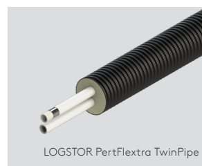
LOGSTOR PertFlextra TwinPipe