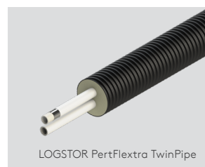
LOGSTOR PertFlextra TwinPipe