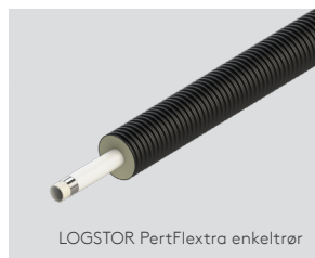
LOGSTOR PertFlextra enkeltrør

Dimensioner på medierør 25-63 mm og kappedimensioner er 90-180 mm.